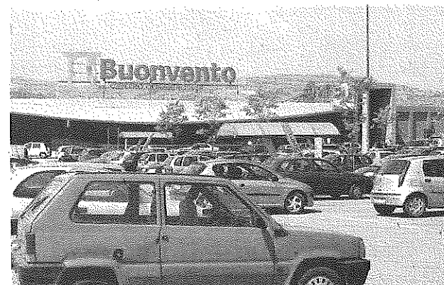
Iniziativa «Buonvento» e Asia insieme per la differenziata

Grande soddisfazione per il risultato straordinario è sta-